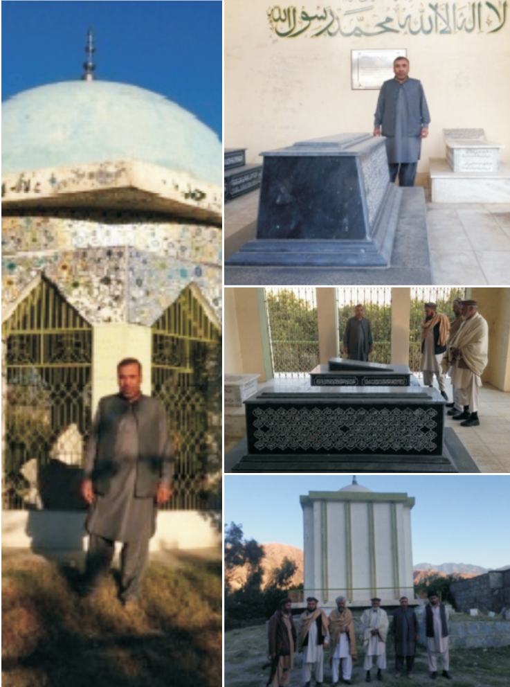
لومړی دوه عکسونه د غازي ميرزمان قبر دی او لاندې دوه عکسونه ، بني خوا د غازي ميرزمانخان او چپ خواته د مرحوم محمد هاشم زماني مقبرې دی.