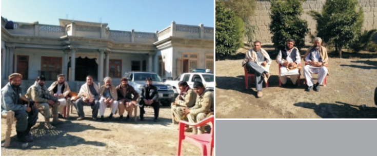
د خاص کونړ ولسوالی د منگوال لیسه د خاص کونړ سربند د کلگرام (حکیم اباد) سره