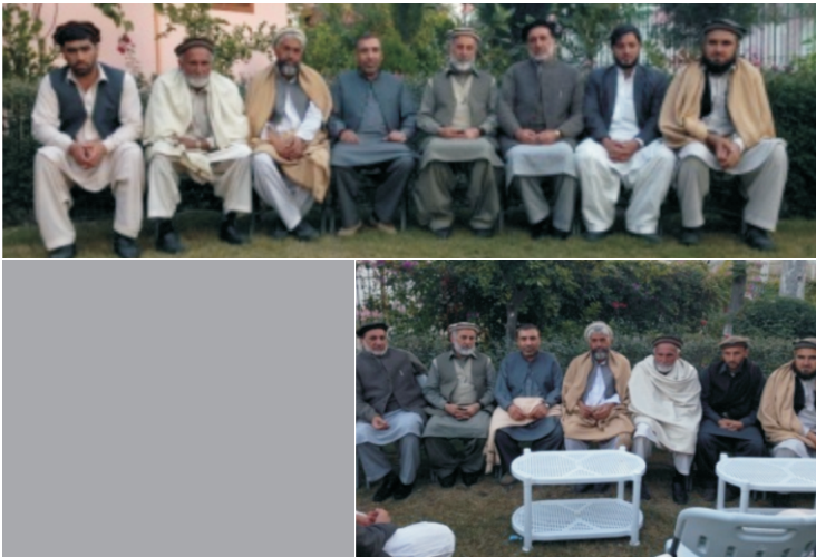
د کونړ والي شجاع الملک جلاله سره د خاص کونړ د یو شمیر مشرانو کتنه

وي. نو په دې خاطر د یو شمیر سپین ږیرو سره د کونړ والي شجاع الملک جلاله سره چې د خاص کونړ ولسوال محمد رحمان دانش هم راسره و وکتل چې په لنډ مهاله توګه د دې سربند چاره وکړي چې اوبه راشي تر څو د غنمو فصلونه ونه سوځي او په اوږدمهال کې دا سربند باید سم جوړ شي. په پراختیایي کمکونو کې وایي چې کمکونه باید په داسې ډول وشي چې چاته ضرر ونه رسیږي ځکه هغه کمکونه چې وروسته د ولس د بې اتفاقی یا ضرر سبب کېږي باید ونه شي. دی ته په انګلیسي ژبه کې Do No Harm Policy وایي. د حکیم اباد پل اوس د خاص کونړ خلکو سربند خراب کړی او د ګټې نه یې تاوان ډیر دی. د زیري بابا د پل ملا هم د بې کپفته کار له وجهې ماته ده. عکسونه دا دي: