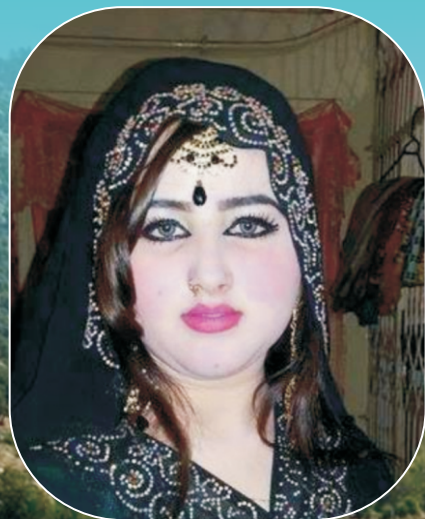
پښتنو جنگونه مه کوی... (مرکه)

د احمد شاه بابا ځير كتوب ته... د کاشغر - گوادر تجارتي دهلیز... د تذکره ليکنې لارې چارې د خوب مانا جرم