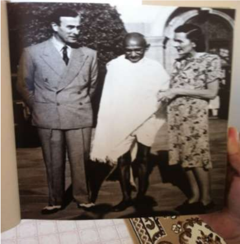
دهند له وروستی وپسرای او هغه له میرمنې سره د گاندي له دغې کتنې وروسته یوڅو ورځې وروسته هند تجزیه شو .

دهند تجزیه د آزادی په نامه ده او نورو کانگرس مشرانو له انگریزانو سره ومنله ، کله چې پاچا خان ددغې آزادی په وړاندې دمخالفت او نه منلو غږ پورته کړ ، دی لومړنی سپری و چې دهغه په خوله یې لاسونه ونیول او ورته ویې ویل چې اوس کار تکرار تیردي باید دادزهر و غږپ ترستونې تیرکړو ، پاچا خان بیا هم ورته وویل چې زموږ اوتاسې پیوستون خو دهندد آزادی لپاره په دغه شان لکه چې تاسې اونهر و یې عملې