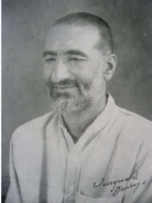
Khan Abdul Gaffar Khan (1890–1988)

Photograph by Vanguard Studio, Bombay –2