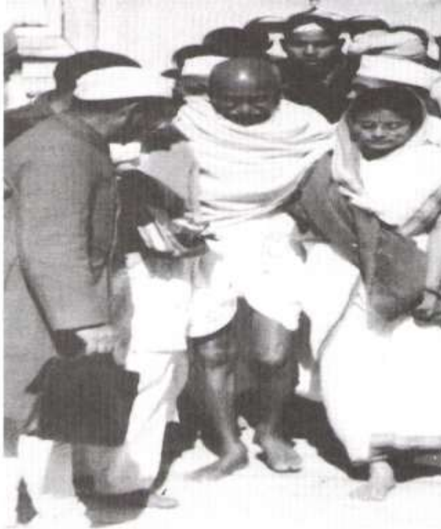
This photo, taken on January 27, 1948, is believed to be the last photo of Gandhi alive. He was assassinated four days later.

موږ دغې تگلارې ته دهغه ايجاد نه شو ويلای ، گاندي په خپله هم په دغه اړه په دې نظر دی چې عدم تشدد دومره لرغونی او پخوانی دی لکه چې زموږ په شاوخوا کې دغه غرونه دي ، مانادا چې دغه تگلاره له انساني نیچرسره مل رامنځ ته شوې اودهغه له پرمختیایي بهیرسره یې یوځای په انساني چاپیریال کې د یوې تلپاتې پدیدې په توګه وده کړې ده . په دغه اړه عمومي باوردادی چې کیدای شي دمعنویت دغه روښانه اوبنیرازه کړنده اوږدمدتي چارو عمل ته اړتیا ولري ، اوکیدای شي ترڅو پښتونواو نسلونو پورې ځان وغزوي ځکه نو دا په خپل حساب سره کومه بې