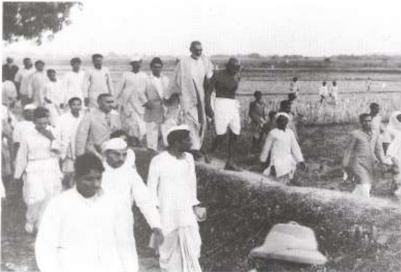
Gandhi travels from village to village in India, spreading his message of nonviolence. Gandhi hoped that his presence would encourage Hindus and Muslims to cease hostilities.

هر اړخیزه توگه په سیاسي ، ټولنيز او فرهنگي لحاظ له یوه درانه رکود سره مخامخ شول ، مانا دا چې دوی په دغه ځانگړي پړاو کې سره له دې چې آزادي یې له لاسه ورکړې وه ، له خپل پخواني معنوي بهیر څخه هم په یوه خوا پاتې شول اوان چې په ډیرو وختو کې یې رابطه له خپل پر تمین تیر سره وشلیده ، یوازې یوه خبره چې په دغه ترڅ کې په ډاگه وه هغه دا وه چې