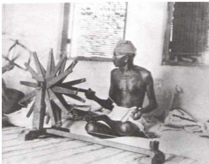
گاندي اودهغه څرخه چې دښکيلاکي توليداتو دنه اخیستلو په ترڅ کې يې خلکوته سپارښتنه کړه .

يوه داوه چې دهنديانوپه ستوني کې بايد دآزادى غږ غلى کړي. اودايې هم دنده وه ،هغوى ته چې دازادى نارې اوسورې وهي بايدسزا ورکړي ، ده ترهرڅه دمخه دهنديانو دآزادى عوښتې پلان ته په سپکه سترگه وکتل ، ټول هغه فعاليتونه چې دآزادى په لاره کې ترسره کيدل دهغوى دمخنويې په لټه کې شو، په لومړي گام کې يې دهند دگانگرس فعاليت ته دپاى ټکى کيښود، هغه يې غيرقانوني اعلام کړ اودهغه زياتره مشران ان دگاندي په گډون يې زندانو ته واچول .