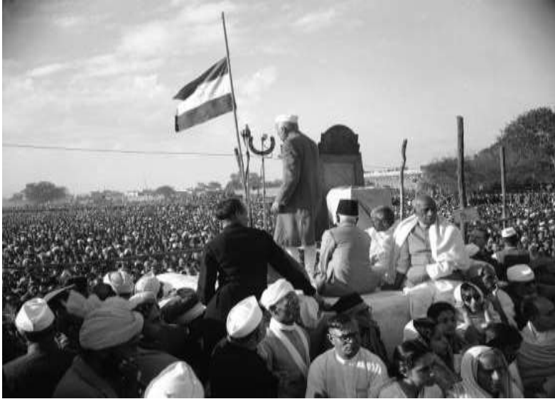
Nehru addressing a huge throng at the Ramlika grounds in New Delhi Feb. 1, 1948, the day following Mahatma Gandhi's funeral