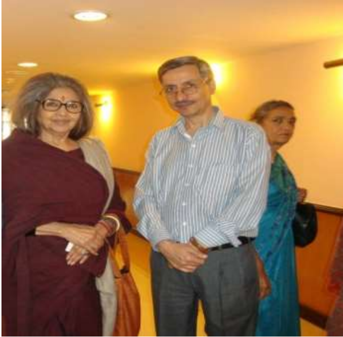
له تارا گاندي (دگاندي لمسي) سره د ليکوال عکس