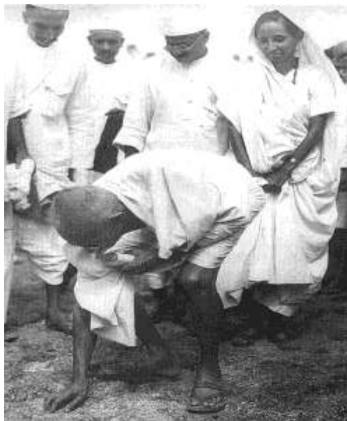
گاندې دمالگې دلار يون پرمهال

مهاتما گاندي په خورا ليواتياسره دغې پوښتنې ته ځواب ورکاوه اوپه دې باورو چې دده خلک او ټولنه بايد تر هر څه دمخه دالمورني څه دځان له پاره ولري ، زده کړه ، روغتيا، او دژوندلومړنۍ اړتيا وې هغه چې دغه خلک هغو زياته اړتيا لري . ده به ويل چې زماخيالي سوراچ زما د بيوزلو خلکو سوراچ او خپلواکي ده، زما د خوب او خيال آزادي کله هم پولې اوقاصلې نه پيژني ، دا بايد يوازې ديوچا او يوې ډلې په واک کې نه وي، سوراچ او خپلواکي مانا دا چې هغه بايد دهرچا ، سترگور ، رانده ، وړي او ترې ټولو په واک کې وي . رښتني خپلواکي به هغه وي چې هغه ټول نارينه ، ښځې او ماشومان په خپل ژوند کې درک کړي او دځان يې وپولي .