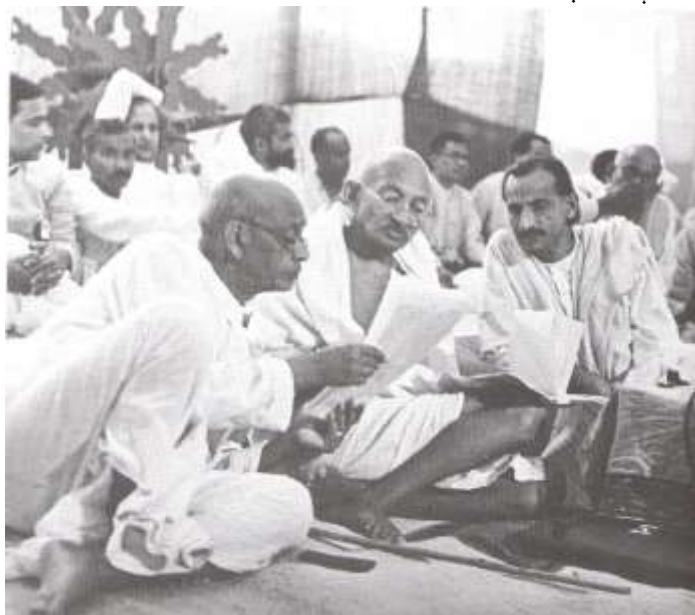
گاندي اودکانګریس ملګري یې پرهغه مهال چې دی ددغه گوند مشر اولارښود دی.

گاندي په دغو کالونو کې ددغه شان غوښتنو دعملی کولو په ترڅ کې په خورا جدیت سره عمل کاوه، چې لاملونه یې دوه وو ، یو دا چې انگریزانو پر هغه وعده باندې چې دلومړی نړیوالې جگړې په ترڅ کې یې کانګرس ته دهند دخپلواکۍ په اړه ورکړې وه وفا ونه کړه ، گاندي هم داژمنه منلې وه، اوهمدغې شیبې ته سترگې په لاره و، خو کله چې له جگړې وروسته خبره برعکس شوه، په دغه حال کې دې دکانګرس دمشرانو او یوشمېر خلکو ترانتقاد لاندې راغی ځکه چې ده په کانګرس زور اچولی و، چې باید دجگړې ترپایه انتظار وباسي ،ده داکاراوخپل پیوستون د دویمې نړیوالې جگړې په ترڅ کې هم له انگریزانو څخه څرگندکړ. په داسې حال کې چې دده داکار دکانګرس ډیرکي مشرانویوه ناکامه هڅه وبلله. دویمه داچې انگریزان په دغه کار سره ترجگړې وروسته نورهم پرځان غره شول ، دخپلو ژمنو پروایې ونه ساتله ، دهند په بیلابیلو سیمو کې یې سوله ایز پاڅونونه په خونړیو پاڅونو واړول او دهندیانو پاریدنوته یې دتورې اوتوپک په زور ځواب