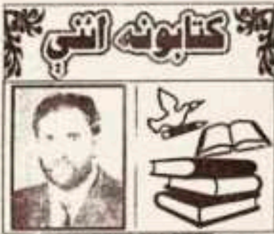
(لائق زاده لائق)

د چادېڼو ځای وټول خوښځ هم نه بنده کړې وه. په کمره کېنې کې