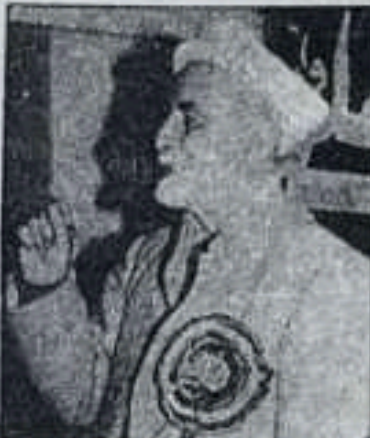
گران کار دی له دې کبله يو څو مهمو ټکو ته مخليده نظر اچول کيږي اجمل خټک د باچا خان، فجر الغان، د لاري

جگ مقام لري. د اجمل خټک د سرپښوې ټول اړخونه په يوه مقاله کې راټولول