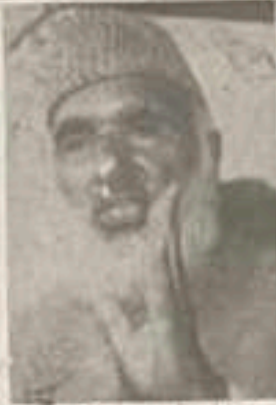
د خاږه راغونښت چې د پښتو د ملي وحدت د پلار په توګه یادېږي، د ۱۹۷۳ کال د ۱۱ مې مېنځ په کابل کې وشو. دغه ورځ د پښتو د ملي وحدت د پلار په توګه یادېږي.

په پښتو کې د ملي وحدت د پلار په توګه یادېږي. دغه ورځ د ۱۹۷۳ کال د ۱۱ مې مېنځ په کابل کې وشو. دغه ورځ د پښتو د ملي وحدت د پلار په توګه یادېږي.