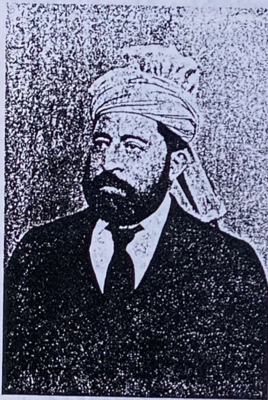
غانمی محمد ایوب خان

۱۸۶۸ء میں سیرتہ ماہی و نیوٹو - خود بخود لکھنے والے علم و سائنس کے دجال آباد ہوئے۔ وہ اپنے والد جہانگیر سے سیکھ کر علم و سائنس کا ہمیشہ دیکھنا شروع کیا۔ وہ ایک فزکس اور کیمسٹری کا تھیوریٹکال سائنس دان تھا۔