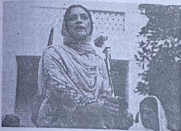
لنيم بي بي

دلايتني اميرکي او جنوبي افريقا کي سڀني ملڪون جو حقو ملاترو کيو شروندي دي وي کي سڀني خوجنيت په لکولو ندي کي