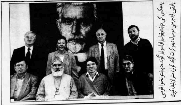
په مکتب کې پښتون/افغان قومي وحدت دغویو سلسله: په مکتب کې بهالید دغویو ځنډی لیدل کېږي

په معدني او زرعي وسايلو پټ او معمور دغه هېواد صرف له دې عمله د غربت او افلاس ژوند تیروي، چې د وسايلو انکشاف یې تراوسه نه دی شوی، خو د انکشاف او معدني او زرعي وسايلو نه د کار اخیستو لپاره علم او سیمه ییز امن ضروري دی. پښتون/افغان قوم د سکندر اعظم نه واخله تر ننه ورځې پورې وسله