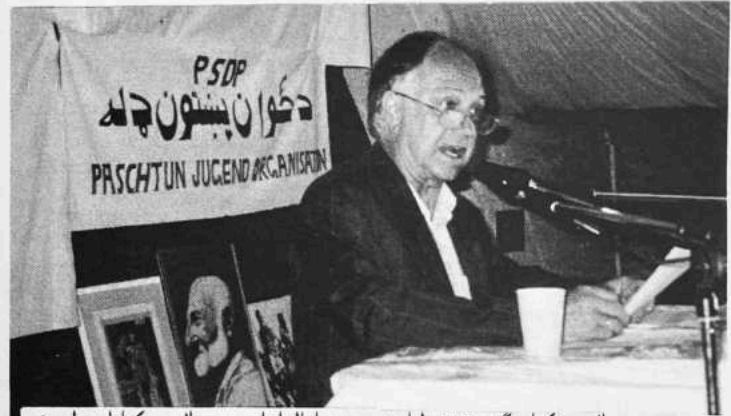
دجرمني سوسيال ډيموکرات گوند SPD له اړخه دپښتنو او المانيانو د سوسيال ډيموکراتانو د ډلې مشر پاکتر گونتر ايکيلي دپښتون/افغان قومي وحدت د پوهنيز سيمينار گډون کوونکو ته د وينا په حال کې

Symbol گڼلی شي. راځي چې لږ ځان ولټوو، چې زموږ د ژبې او کلتور څه حال دی. خوشال خان بابا د پښتو ژبې يو بې مثال شاعر تهر شوی دی. خوشال بابا د يونيورسټيو گريجوېټ نه وو، خو د هغه افکار د هند د مشهور شاعر علامه اقبال په شاعري کې د روح په شان غږېږي. څومره پښتانه دي چې د خوشال د مقام نه خبر دي.