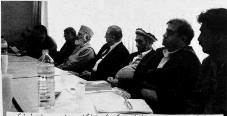
دپښتون/افغان قومي وحدت دغونډو سلسله: په عکس کې دفرانکفورت دغونډې څڼې ليدل کېږي

داسې ونه شو، پرنګي په دې منطقه کې د يو حاوي قوت په حيث موجود پاتې شو. هغه د افغانستان په خاوره په غير مستقيم ډول خپل اقتدار قايم کړو. د احمد شاه بابا په خاوره چې څومره سدوزي او بارکزي حکمرانان راغلل، هغوی د خپل اقتدار د ساتلو لپاره د پرنګي لمن ټينګه کړه. دوی په خپل قوم د پرنګي په مشوره او د