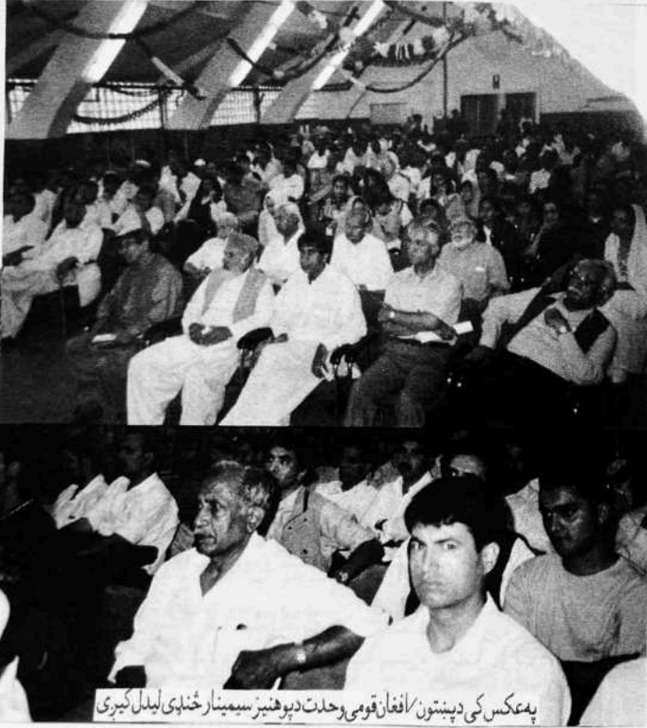
په عکس کې د پښتون/افغان قومي وحدت د پوهنیز سیمینار څنډې لیدل کېږي

نو هغوی دې خان څرګند کړي. داسې خلک بې شکه د دې آزاد ملک د پولې نه بهر خانله یو نوی ظالم حکمران غوره کولای شي. خو قوم په یو خوله او یو زړه هغه ته دا ډاډ ورکړو، چې د گټلې آزادۍ به په هر قیمت دفاع کولای شي. دغه آزادي صرف یو کم دېرش کاله یعنې د کال ۱۷۳۸ پورې برقراره پاتې شوه. د ایران له خوا نه نادر