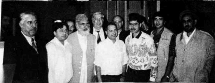
د پښتون/افغان قومي وحدت د غونډو سلسله: په عكس كې د بلجيم د غونډې څڼې ليدل كېږي

منځ كې د خپلې اصلي وسلې سره د پرنگي د شكست وجه دا وه چې پښتون/افغان قوم د قومي وحدت جذبه ژوندى وه او دوى يې د مبارزې لپاره ميدان ته راوويستل او د خپلې آزادۍ تحفظ ته يې وگومارل په دغه اساس پرنگي د افغان قوم د قومي وحدت د پاره پاره كولو فيصله وكړه.