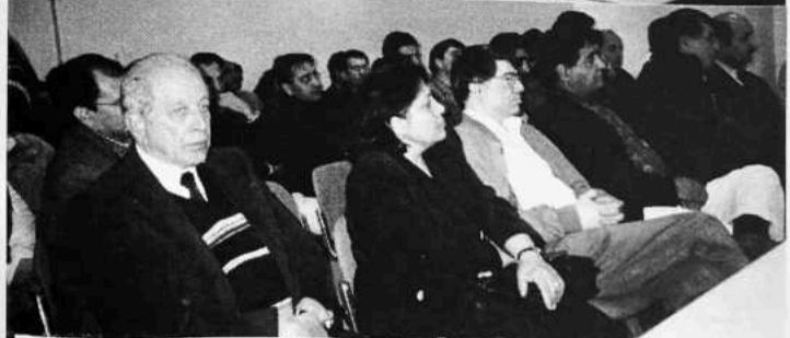
دپښتون/افغان قومي وحدت دغونډو سلسله: په عکس کې دفرانکفورت دغونډې څڼې ليدل کېږي

داسې ونه شو، پرنګي په دې منطقه کې د يو حاوي قوت په حيث موجود پاتې شو. هغه د افغانستان په خاوره په غير مستقيم ډول خپل اقتدار قايم کړو. د احمد شاه بابا په خاوره چې څومره سدوزي او بارکزي حکمرانان راغلل، هغوی د خپل اقتدار د ساتلو لپاره د پرنګي لمن ټينګه کړه. دوی په خپل قوم د پرنګي په مشوره او د