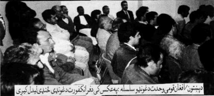
دپښتون/افغان قومي وحدت دغونډو سلسله: په عکس کې دفرانکفورت دغونډې څڼې ليدل کېږي

آزاد هېواد په آزاده فضا کې دا اعلان کوم، چې د پښتون/افغان مسئله صرف او صرف د قومي وحدت د ترلاسه کولو سره حل کېدای شي. لاز کې کېچنه ده خو منزل ته د رسېدو بله لاره هم نه شته. گرانو هېوادوالو!