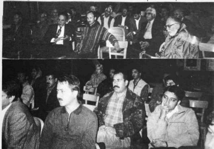
د پښتون/افغان قومي وحدت د غونډو سلسله: په عكس كې د نمونشن گلاډېنچ د غونډې څڼې ليدل كېږي

افغان د تاريخ دوه ډېر اهم واقعات په داسې ترتيب منع ته راغله، چې هغې دا خبره بېخي واضح كړه، چې د برصغير او مركزي آسيا ترمنځه كوم قوت موجود دي په دې منطقه كې هم دغه قوت، قوت قايمه بلل كېداى شي. د پرنگي حكومت په هندوستان ډېر په آسانه قايم شوى و. د ۱۸۳۶ پورې پرنگي دا گټله، چې په هند كې د طاقت توازن د هغه په حق كې دى او دا چې په هند كې د مغل اقتدار چې بنياد يې د پښتون/افغان قوم په متيو او عسكري قوت