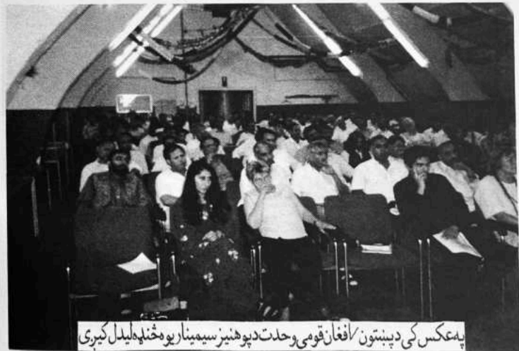
په عکس کې د پښتون/افغان قومي وحدت د پوهنيز سيمينار يو څنډه ليدل کېږي

ملگرو! زه خپل نننۍ تقرير له هم هغه ځايه پيل کوم، کوم چې ما په پېښور کې ستاسو وړاندې کړی ؤ او په چاپ شوي شکل کې ستاسو مخکې وړاندې کړی و، وجه دا ده چې په دغه تقرير کې ما هغه بنيادي مسئله په گوته کړې وه کومې سره چې موږ له ډېرې مودې راهيسې مخامخ يوو. د پښتون / افغان قوم مسئله په دوی کې د قومي وحدت نشتوالی دی او زه په دې عقیده يم چې که نن د