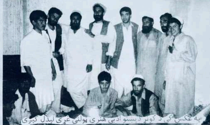
په عکس کې د کونړ د ښوونکي هنري ټولني غړي ليدل کيږي