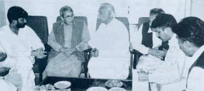
په عکس کې د پاکستان د ادبياتو د اکاډمې د غونډې خټکې ليدل کېږي