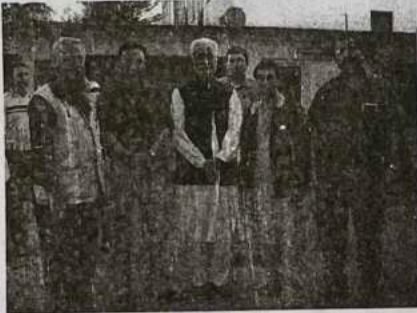
د پښتنو ټولنيز ولسوليز گوند Pashtoons Social Democratic Party د PSDP