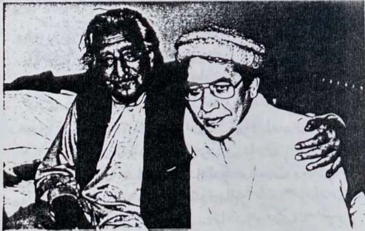
ستوری دغنی خان سرہ

وواپہ دا قہ شی دی ہم نما خولک دی ہم خورلی بنا پیرکے دی ہم د نیری ہم دھوسی ہم ن منبرکے دی اوسی پہ خرمناہ کینے مانکے پہ تعلیف خوب د پندی تالوز دی ملاء صاحب پری وکے دی بریت لے چہر بنبر لولے وی نیرہ پیر بنبر دلے وی پینے اراتے نیرکے وی او بی لے لکولے وی عجیبہ مسرہ شہی دی - وواپہ دا قہ شی دی؟