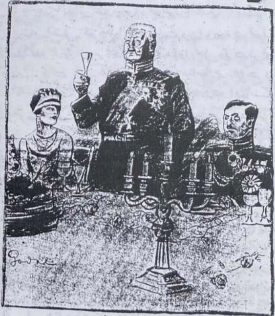
(غازی امان اللہ خان۔ صدر صحنین بزرگ۔ او سواریا برلن کینی)

اوس دکالرنے او سٹیوی جھلے کھلے گھرنڈے روانے وے شلمہ پیرکے