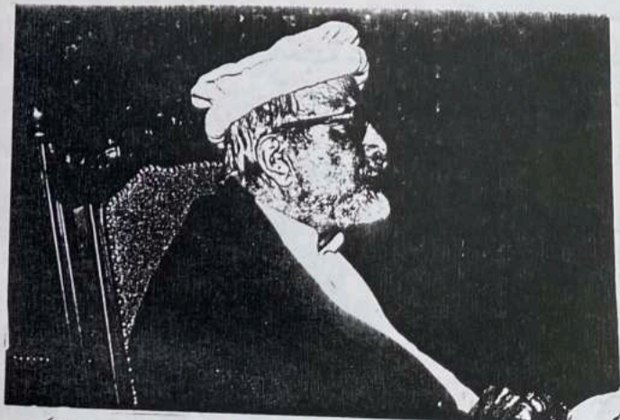
د پیننو شیاستی شش نامتو کیلوال او فیلسوف اجسل ختک

خپله شملدی شموه ویلی ی شرو او پینو عنبری کور نه خوالی پوستری شیلید و لار ماوی مزدور: نه جنت پیثی؟ د خیل تند خولدی چه کوله وی چی موه کیسه: خواجه خوبونه بولیوی غوندی په لار تیویدو ماوی چه فیثنی نه خه وای؟ خیل بیو شری کور ویلی بس انسان د خوشالو خوبونه ماوی خیل نه تر سر و پیلته کولو ده په او تو و سترگو بره کتل دی شین انسان نه غوی د ویلی ما او ویل تری دا او خوبونه ویلی ای د لامکان خاوند په خیل مکان کئی خیل خیار جنتی هکی دغه لیونون په نامه که نارو مار له دای و د ار جنت د