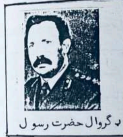
د گروال حضرت رسول

په افغانستان کېنى د شور د ۱۳۵۲ کال نظامي پاڅون وروسته چې د شوروي سوسياليزم او کمونيزم ايد يالوژي په فکر او خيال کېنى ولاړه وه او په افغانستان کېنى د نوموړي ايد يالوژي تحليل په بشپړه توگه څرگند شوى نه و او په تيره بيا هغه ليد ران چې د گوند په سر کېنى ئى قرار