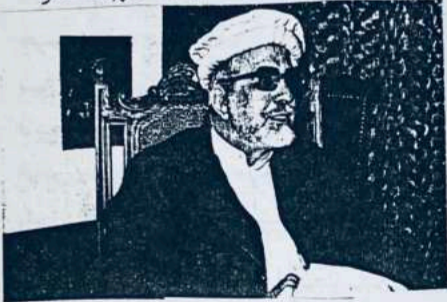
" اجمل خټک "

بن: د پښتنو د ټولنیز اولسولیز گوند مشرتابی په نری او سیمه کښی د بدل شوو حالاتو په رڼا کښی د پښتنو د وړوند مشر اجمل خټک د پښتنو د حالاتو او راتلونکی په باره کښی د نظریو بدلون د پاره جرمنی ته رامیله کړیدی د پښتنو د ټولنیز اولسولیز گوند