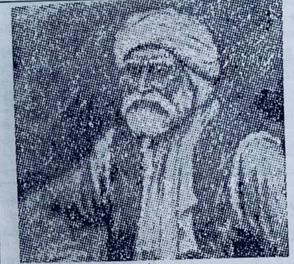
خوشحال خان بابا ( ۱۰۲۲ - ۱۱۰۰ هـ یا ۱۶۴۳ - ۱۷۲۱ ع )

زه خوشحال د شهباز خان یم شهباز خان دیحی خان و یحیی خان داکووری و داکبر بادشا په دور د هجرت زردوه ویشتن سن و هغه کال پوره پنځوس و