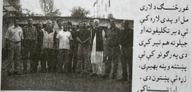
غورځنګ د لاری مل او پدی لاره کې یې ډیر تکلیفونه او جیلونه هم تیر کړي دی په رګونو کې یې پښتنه وینه بهیري، زړه یې پښتون دی. ارزښتناکی

کلنۍ عمر کې هم د پښتنی کلتور، ژبې او ادب چوپړ ته د خپل ژوند تر اخری سلګی پورې په پوره ژمي ایماندارۍ او میرانه ملاتړی ده. که څه هم دی سپین ږیری دی خو حوصله، زغم، عزم او اراده یې پیاوړی او ځوانه ده. د خدای خدمتګار و