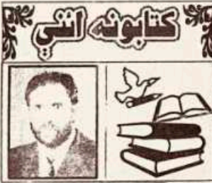
(لائق زاده لائق)

نه بنده کړې وه. په کمږه کېنې مې د چاد پښو خاڼې ولټول خو هيڅ هم